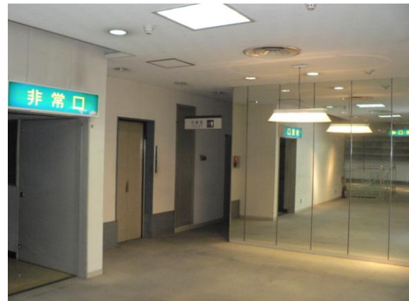
1階ホール奥から通じる階段、エレベーター。男女別トイレあり。