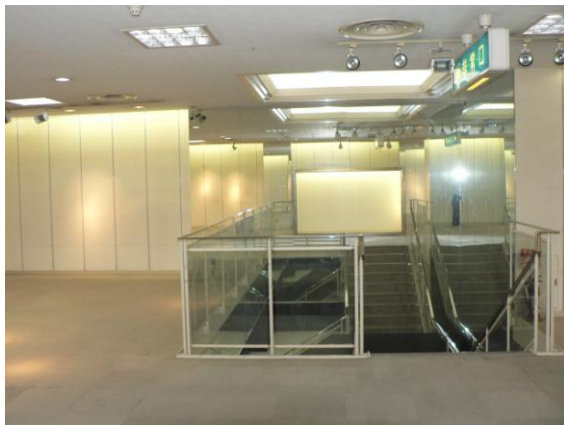
1階ホールからの階段